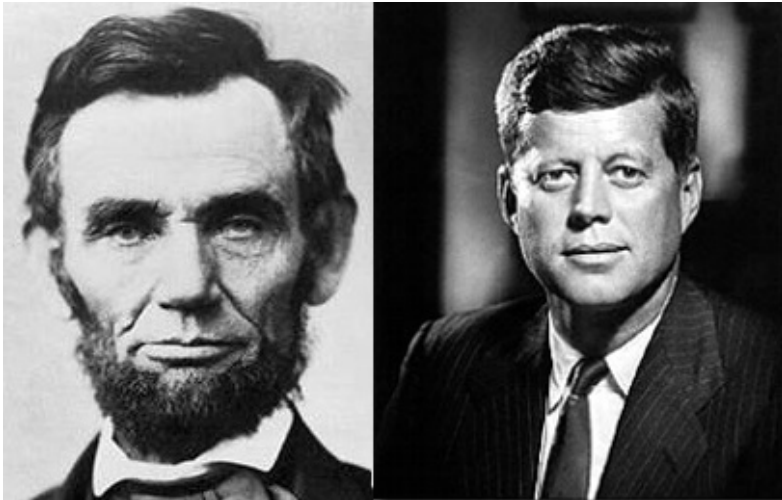
Οι πρόεδροι Λίνκολν αριστερά και Κέννεντυ δεξιά.

Όταν δολοφονήθηκε ο πρόεδρος Κέννεντυ, κάποιοι έγραψαν για αντιστοιχίες χτυπητές με τον Λίνκολν... Και σήμερα ακόμα αυτές απασχολούν πολλούς.