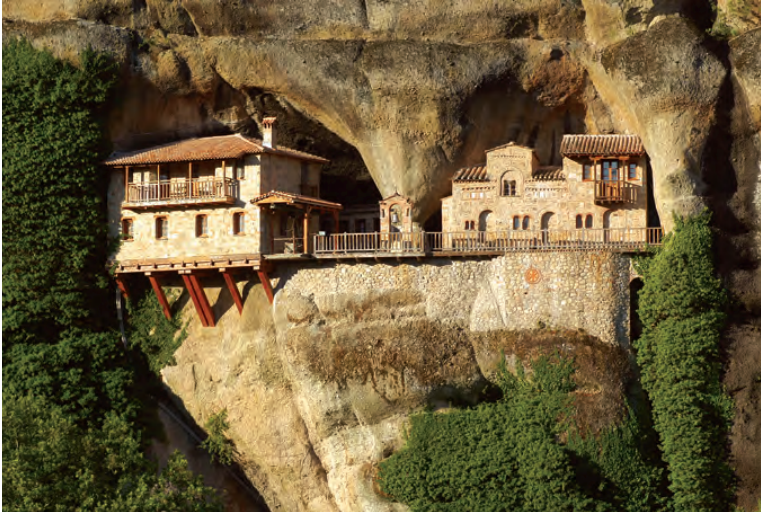
Ἱερά Μονή Ὑπαπαντῆς, Ἁγίων Μετεώρων